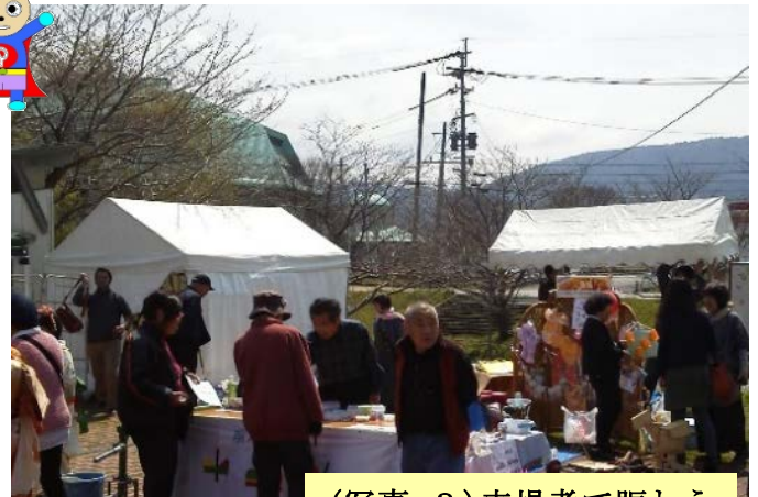
(写真-3) 来場者で賑わう発明アイデア作品展示場。