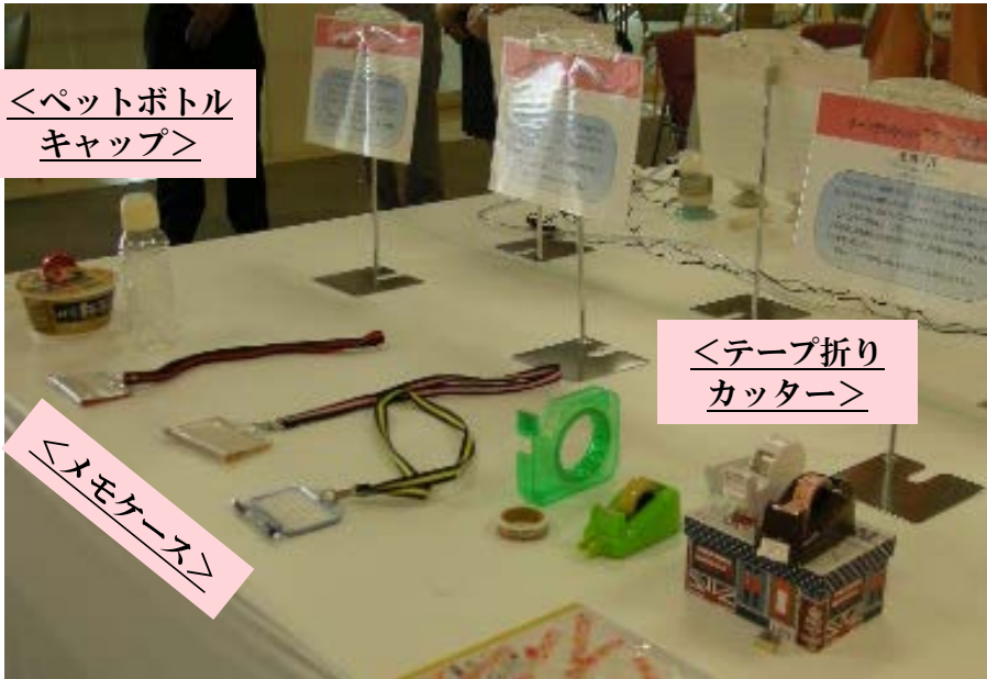
<ペットボトル キャップ>