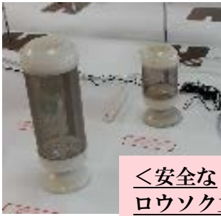
<安全な ロウソク立て>