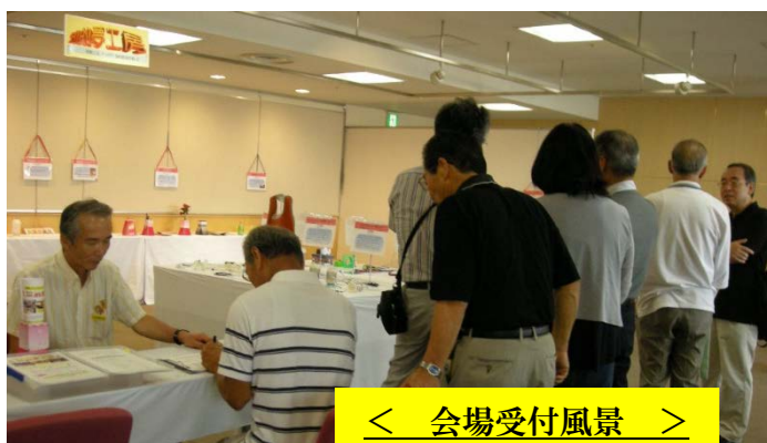
< 会場受付風景 >

熊本では 4 月に「平成 28 年熊本大地震」が発生し、2 度の震度 7 の揺れに見舞われ大きく被災しました。そのような時に作品展などを・・・と躊躇する思いもございましたが、幸いにも鶴屋百貨店のご努力により 7 月にはギャラリー会場が再開となりましたので、この日の為に準備を進めて参りました作品をぜひ見て頂きたいと開催致しました。