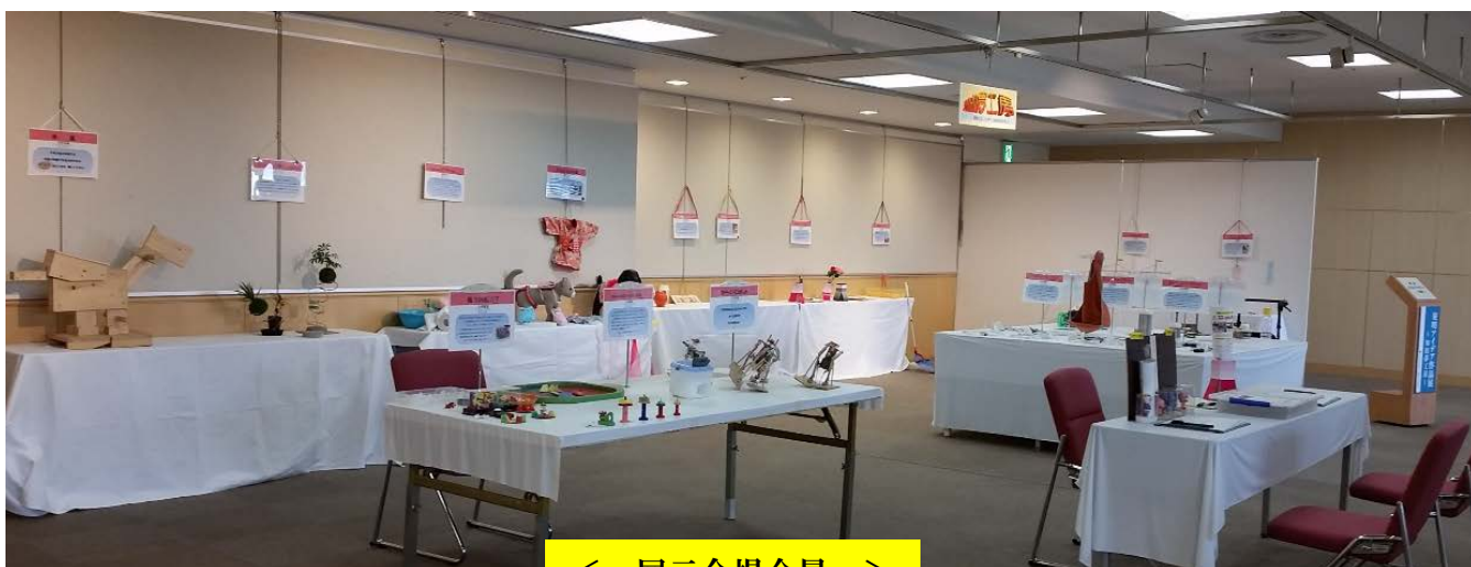
< 展示会場全景 >

展示作品数は 20 点で、“日常の暮らしに役立つ便利な発明アイデア作品”をテーマに、いろいろのジャンル(日用雑貨、スポーツや遊び、福祉や介護、健康や癒し、ペット、インテリアなど)のものを写真の様に展示致しましたのでご覧下さい。