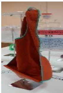
<食べこぼし用 エプロン>