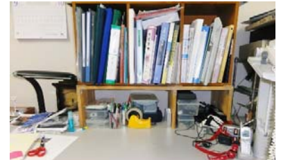
(写真1)三段ボックスの活用

私が物を作る時に心がけているのは、以下の3つの事項です。 A) この不便な物、何とかならないか。 B) 捨てるのはもったいない。何かに使えないか。 C) 便利な物だけど、もっと便利な使い方はないか。これらの事項から考えたもので、まず Aの発想です(写真1) 。三段ボックスはどなたでも使用経験があると思いますが、机の上に置くと場所を占拠してしまうのが難