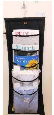
(写真3)ワイシャツラックの活用

型封筒で郵便物がくることが多いのですが、廃棄するのはもったいないと考えました。分類別のラベルを作り書類保管に利用しています。通常 active な書類は1割程度で、念のための保管というものが多いので、ラベルには保管期限を記入し時期が来たら廃棄しています。最後に Cの発想です(写真3) 。アイデア商品でワイシャツラックが売ってありました。ちょうどそれにはA4版の冊子が入りますので、オフィスでは小冊子入れとして利用しております。それぞれ表紙が見えますので、目につきやすく便利です。