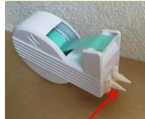
テープ先端部折 り曲げ用の凸部