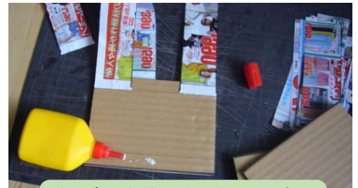
(写真 1) 使用材料の段ボール、チラシ、ノリ類。

材料は失敗してもいいように、段ボールとチラシを使いました。作業は罫線書きから始まり裁断そして糊付け組立てで、簡単順調で和気あいあいでの作業でした。最後の仕上げはちょっと難しく、試行錯誤しているうちにあっという間に時間が来てしまい、完成出来ませんでした。楽しくカラクリの仕組みを理解してもらったのではないのでしょうか。