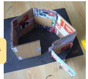
(写真 2) もう一息で組立て完了の図。

これを機会に、昔のいろいろなカラクリ“茶運び人形、段返り人形、文字書き人形、万年時計など”に興味を持ってもらい、発明のヒントに役立ててもらえれば嬉しいなあ～と思っています。(村里英明)