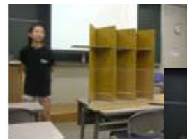
学生さん達のプレゼン