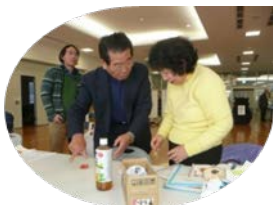
三角錐の組み立てごみうけ